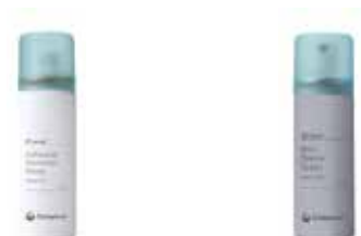
Removedor de Adesivo em Spray

É difícil ou doloroso remover o adesivo?