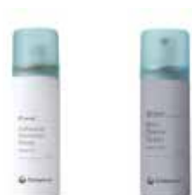
Removedor de Adesivo em Spray

Pele irritada com vermelhidão que possa ser causada durante a limpeza e/ou aplicação-remoção do dispositivo?