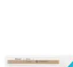
Pasta em Tiras